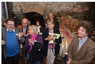
Kellerbesuch Schloss Neuweier, Baden-Baden, rechts der ...