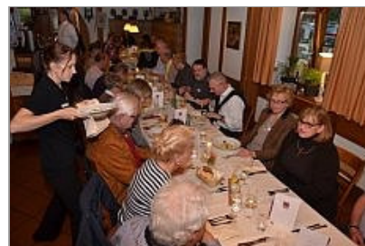
Kulinarische Weinprobe im Holzöfele Ihringen mit ...

05.05.14 - FULDA - Am Samstag 10. Mai 14 – 18:30 beginnt die Saison der Weinfeste im Fuldaer Weinberg im 25. Jahr des Weinhistorischen Konventes. Auch wenn die Fuldaer Weinfreunde – wie die Winzer in ganz Deutschland noch Frost und Hagel fürchten, sind sie doch auch froh, dass die Gäste am Samstag die neuen Austriebe bewundern können. Wie üblich gibt es die gute Bauernwurst, Käseteller, Bretzeln, Käsestangen und mehr für den Magen und gute Ausschankweine – auch zwei neue Pfälzer Weine für den Gaumen. Die Veranstaltungen – jeweils am 2. Samstag in den Monaten Mai bis September sind auch die Gelegenheit für Neugierige Wein vom Frauenberg zu genießen. Am 14. Juni wird ja ganz groß im Rahmen des Tages der offenen Gärten am Frauenberg der 25. Geburtstag beim Reblütenfest gefeiert.