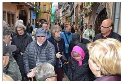
Stadtführung in Riquewihir ...